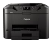
MAXIFY MB2750 Modelle